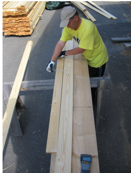
Kuva 3. Kuusisaheiden mittaaminen ja ulkonäköhavaintoihin (visuaalisuuteen) perustuva laatu luokittelu.

Tutkituista viidestä alueesta tukkipuu oli selvästi hidaskasvuisinta eli tiivissyisintä Kainuussa ja kuusen tukkipuu tämän ohella Vologdassa. Mänty oli kiekkomittausten perusteella leveälustoisempaa (harvasyisempää) Novgorodissa ja Vologdassa (1,9 mm) kuin Itä- ja Länsi-Suomessa (1,7 mm) ja varsinkin Kainuussa (1,4 mm). Puuaineen tiheyteen olennaisesti vaikuttava kesäpuun osuus oli vastoin oletuksia korkein Kainuussa ja alhainen varsinkin Novgorodissa. Kuusi oli leveälustoisinta Itä- ja Länsi-Suomessa (2,3 mm ja 2,1 mm) ja ohutlustoisinta Kainuussa ja Vologdassa (1,5 mm). Kesäpuun osuus oli korkein Itä-Suomessa ja alhaisin Vologdassa ja oletusten vastaisesti Venäjän Karjalassa. Sydänpuuta venäläisessä tukkipuussa on korkean iän vuoksi yleensä enemmän kuin suomalaisessa.