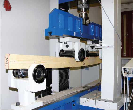
Kuva 2. Kuusisaheen taivutuskuo kimmomoduulin ja taivutusmurtolujuuden määrittämiseksi.

Tukkien alueelliset laatuerot olivat männyllä ulkoisen arvioinnin mukaan selvästi suuremmat kuin kuusella. Mäntytkit kuten myös kuusitukit olivat Venäjällä yleensä suuremmasta järeydestään (varsinkin väli- ja latvatukit) huolimatta oksikkaampia kuin Suomessa. Suuremmat tukit Venäjällä ilmensivät sekä järempiä tukkipuita että pienempää tukkisaantoa venäläisissä hakkuissa (ns. tukin ulosottoprosentti). Tukkien suoruuslaatu oli Venäjällä varsinkin väli- ja latvatukeilla huonompi kuin muilla alueilla, mutta kuusella keskimääräistä huonompi myös Kainuussa. Männyn tyvitukkien laatu jakauma oli kaikki tekijät huomioon ottaen selvästi paras Itä-Suomessa ja toiseksi paras Länsi-Suomessa, kun taas Kainuun ja Vologdan ja varsinkin Novgorodin tukit olivat selvästi heikkolaatuisempia. Kuusen tyvitukit ja varsinkin muut tukit olivat laadukkaimpia Itä-Suomessa ja muita alueita heikkolaatuisempia Venäjän Karjalassa ja Kainuussa.