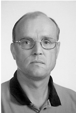
■ Mikko Hyppönen